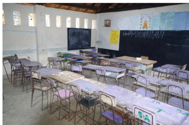
Foto 1. Het klaslokaal toen we aankwamen

We hebben op een school in Galle een aantal klaslokalen en zo'n 80 tafels en stoelen helemaal geleverd. Dit was hard nodig omdat het er allemaal oud en niet echt vrolijk uitzag. Er waren duidelijk verschillen te zien tussen de klaslokalen bij ons op Het Noordik en die in Sri Lanka. Wij hebben veel meer en betere tafels en stoelen, in Sri Lanka maken ze nog gebruik van een krijtbord terwijl wij digitale borden hebben, ook zie je het verschil met ons aan de kleding van de kinderen en de speelplaats met alleen een aantal verroeste klimrekken.